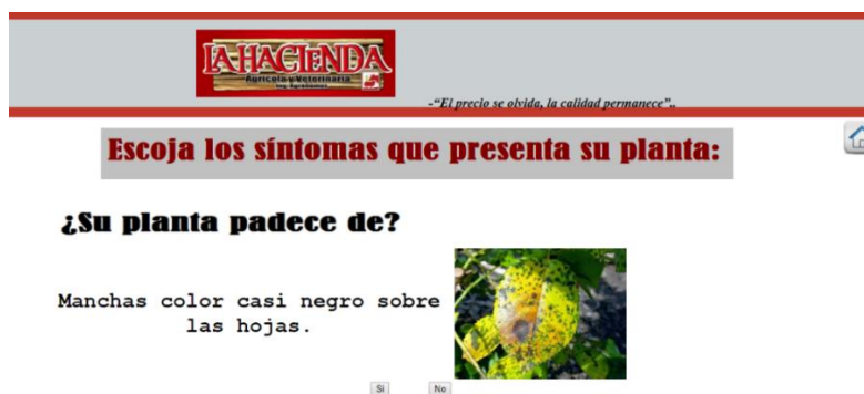
Figura 4. Pantalla principal

La fase de pruebas se aplicó a los usuarios que llegaron en un día determinado día a la empresa “La Hacienda”, para solicitar asesoramiento o a compra productos; se les preguntó si estaba de acuerdo en hacer uso del SE para el diagnóstico de plagas y enfermedades en plantas ornamentales.