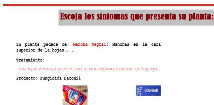
Figura 5. Respuesta de si han las plantas han presentado alguna enfermedad o plaga

En la tabla 3 y la figura 5, se observa el desarrollo del SE, y el diagnóstico final y la recomendación posible a aplicar.