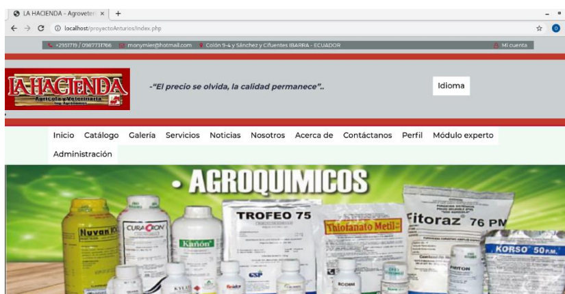
Figura 3. Pantalla principal

servidor de pruebas local se usó Apache, en la construcción se tuvo en cuenta el frontend para la comunicación con el usuario. Al finalizar el resultado se visualiza en la figura 3.